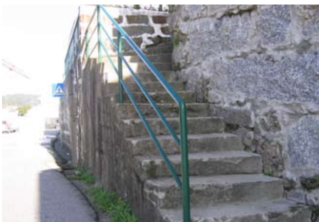
Protecção nas escadas da Rua da Pisca à Boavista