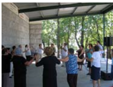
Tarde de dança para recordar