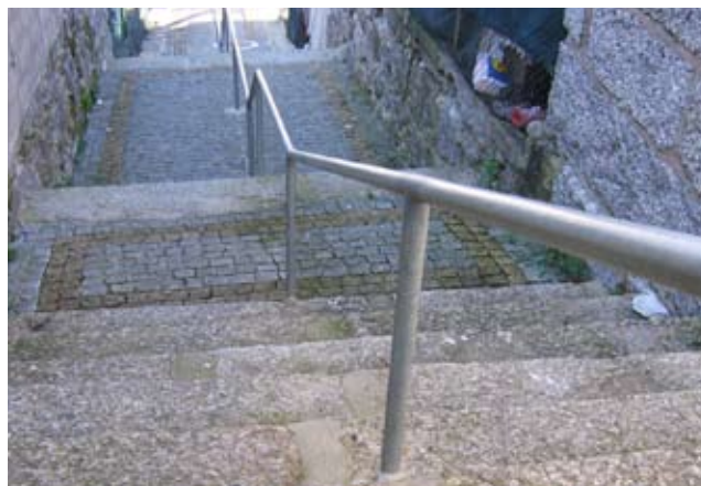
Pavimentação e colocação de Corrimão na Travessas da Rua Infante D.Henrique.