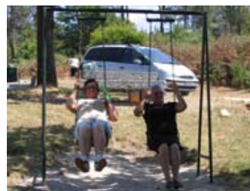
O Baloço também funcionou

Se tens mais de 60 anos Inscreve-te na Junta de Freguesia de 22 de Maio a 15 de Junho E no dia 6 de Julho (quinta-feira) aparece Com o merendeiro!!!