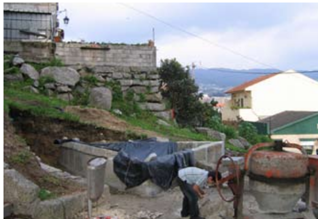
A Reconstrução do Tanque da Barroca no Parque da Senhora da Luz foi a solução encontrada pelo executivo da Junta que agradou aos utentes daquela estrutura social que há muito a reclamavam.