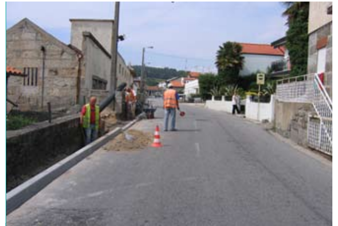
Rua da Pisca com Passeios

Por ser manifestamente insuficiente para responder ao fluxo de trânsito naquela artéria, a Junta de Freguesia, depois de negociar com os proprietários a cedência do terreno, demoliu um muro e procedeu ao alargamento da entrada da Rua de S. Sebastião.