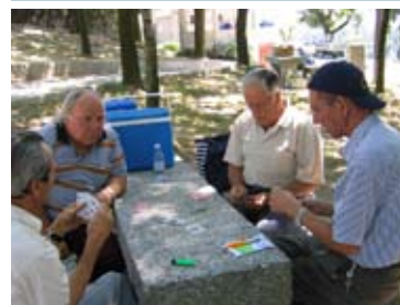
Jogo da Sueca

>> A Junta de Freguesia, em Julho de 2006, promoveu o 3º Passeio Sénior a Serras de Fafe – Parque de Sant’ana - Moreira de Rei, com grande participação e aceitação, uma vez que este evento não foi mais do que uma forma simples de proporcionar aos Idosos da Freguesia, momentos de lazer e convívio e ainda dar a conhecer espaços do território nacional com interesse histórico, cultural e turístico”. Este passeio contou com a visita à Barragem do Ermal, passagem na Senhora das Neves com uma celebração Eucarística seguindo depois para o Parque de Merendas de Sant’ana.