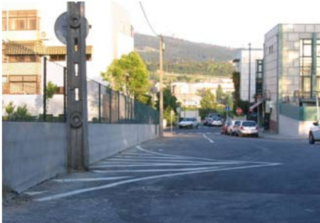
Alargamento Rua S. Sebastião

Por ser manifestamente insuficiente para responder ao fluxo de trânsito naquela artéria, a Junta de Freguesia, depois de negociar com os proprietários a cedência do terreno, demoliu um muro e procedeu ao alargamento da entrada da Rua de S. Sebastião.