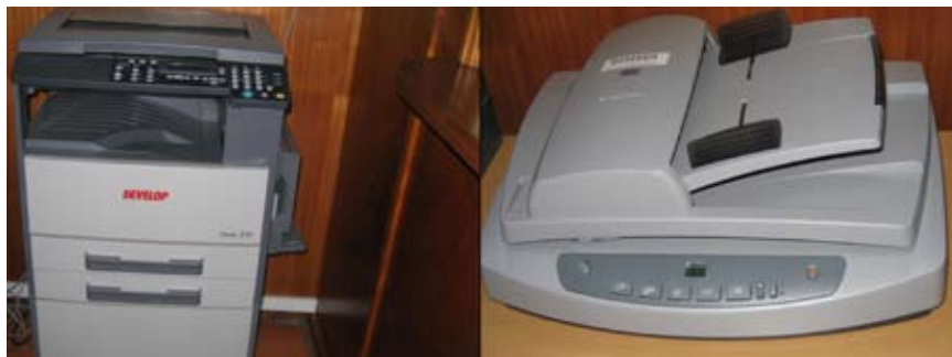
Com a conclusão do Programa de Modernização Administrativa, foram adquiridos novos equipamentos para a Junta.