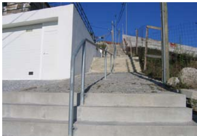
Corrimão de Apoio nas Escadas – B° Santa Terezinha

A Junta de Freguesia executou passeios na Rua da Pisca, uma zona fabril bastante movimentada, respondendo assim as reivindicações dos moradores e das pessoas que circulam naquela artéria.