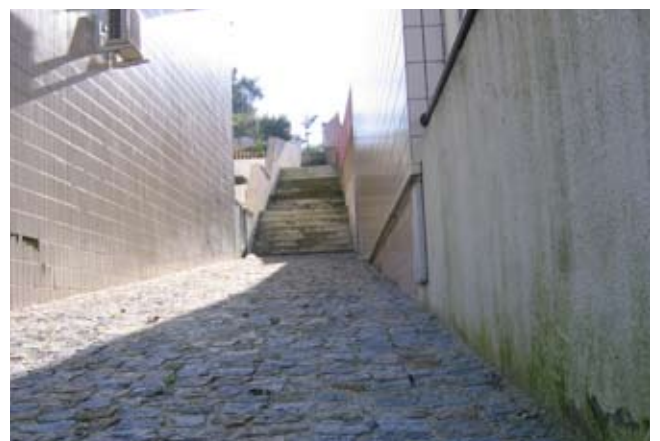
Pavimentação e execução de escadas na travessa Bouça do Pinheiro