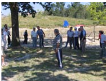
Jogo do Chincalhão